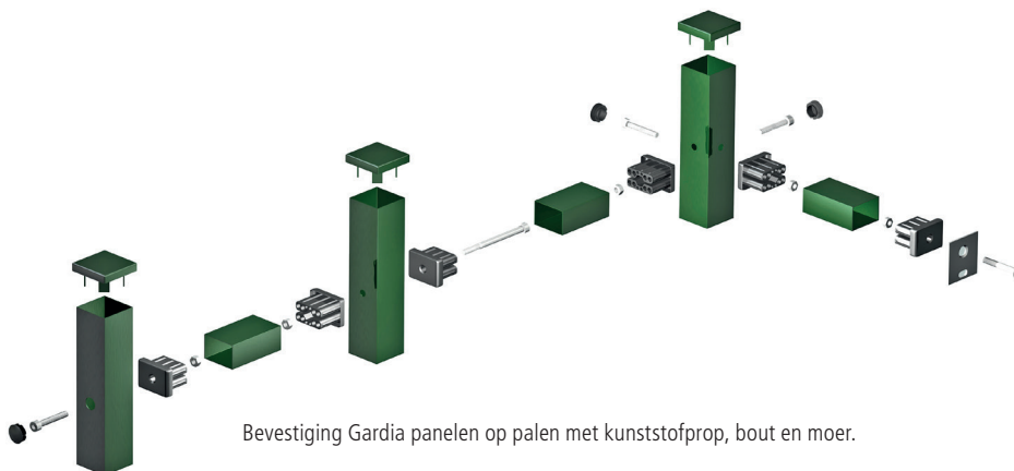
Bevestiging Gardia panelen op palen met kunststofprop, bout en moer.

Kopal NV/SA Ieperstraat 75A 8610 Kortemark